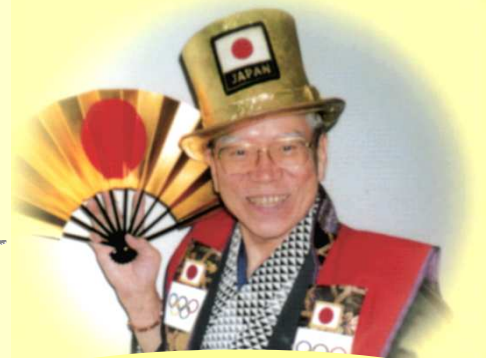
三代目 日本国笑裁

私も笑いで健康を応援しています。 笑う顔には福来る!! たくさんのご出場!ご来場を待っています!